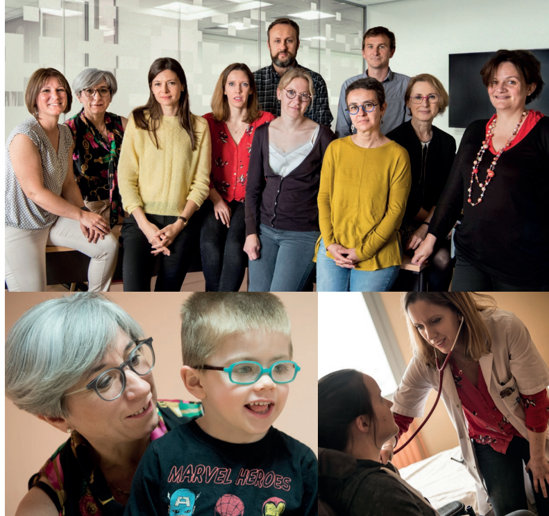
Équipe neuromusculaire pédiatrique.

Le Centre de Référence Maladies Neuromusculaires de Brest (CRMNM) a été labellisé en 2017 dans le cadre du plan national maladies rares. Il est rattaché au Centre de Référence des Maladies Neuromusculaires Atlantique Occitanie Caraïbes. Il dépend de la Filière Filnemus (Filières Maladies Rares).