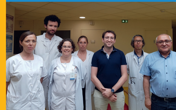
Équipe neuromusculaire adulte.